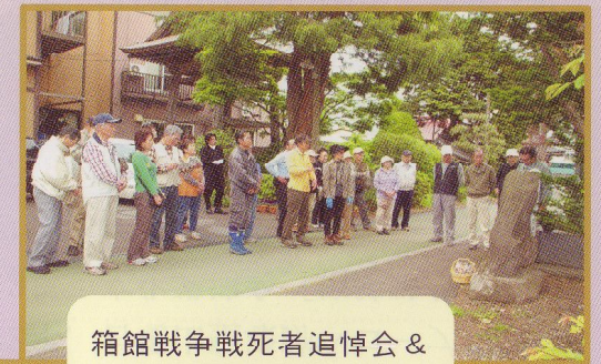
箱館戦争戦死者追悼会 & 史跡めぐり・6月上旬