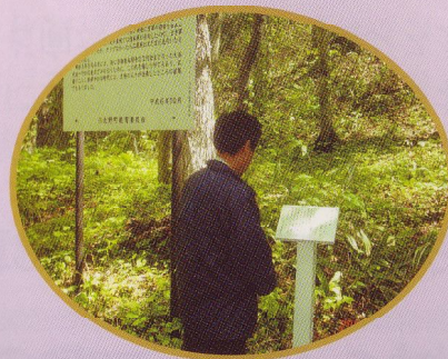
台場山に建つ説明板と句標